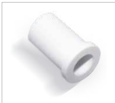
1 Артикул 340.0054.0