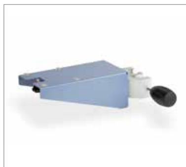
9 | Артикул 313.0012.0