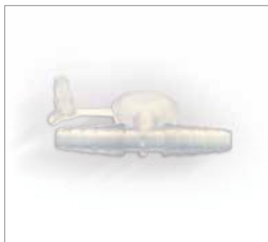
5 Артикул 000.0347.0