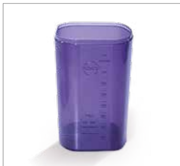
1 | Артикул 313.0015.0