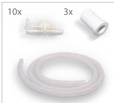
2 Артикул 313.0160.0