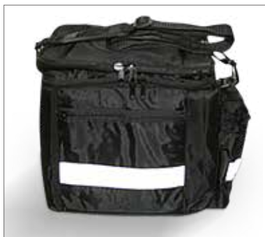
7 | Артикул 313.0011.0