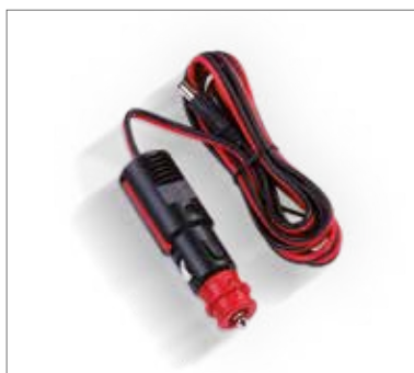
8 | Артикул 313.0436.0