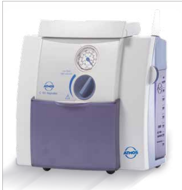
2 | Артикул 313.0000.0