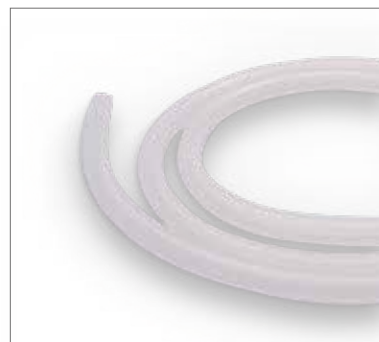
3 Артикул 006.0009.0