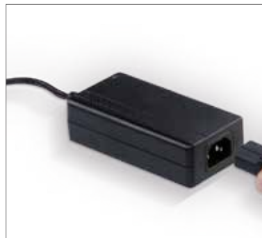
6 | Артикул 313.0080.0