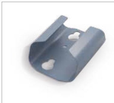
5 | Артикул 313.0007.0