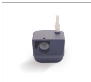
3 | Артикул 313.0006.0