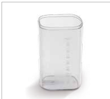
2 | Артикул 313.0017.0