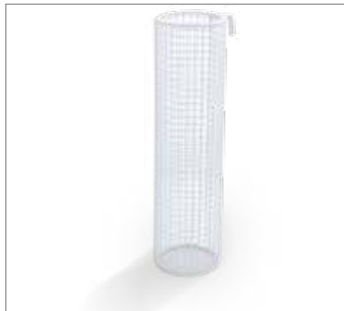
11 | Артикул 444.0140.0