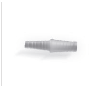
4 | Артикул 000.0836.0