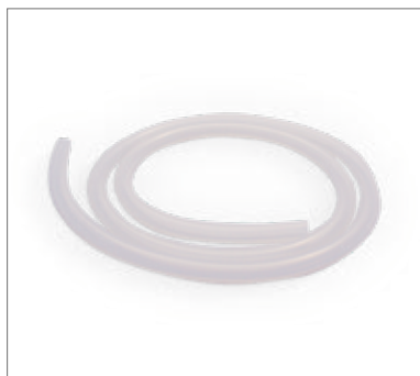
4 Артикул 000.0013.0