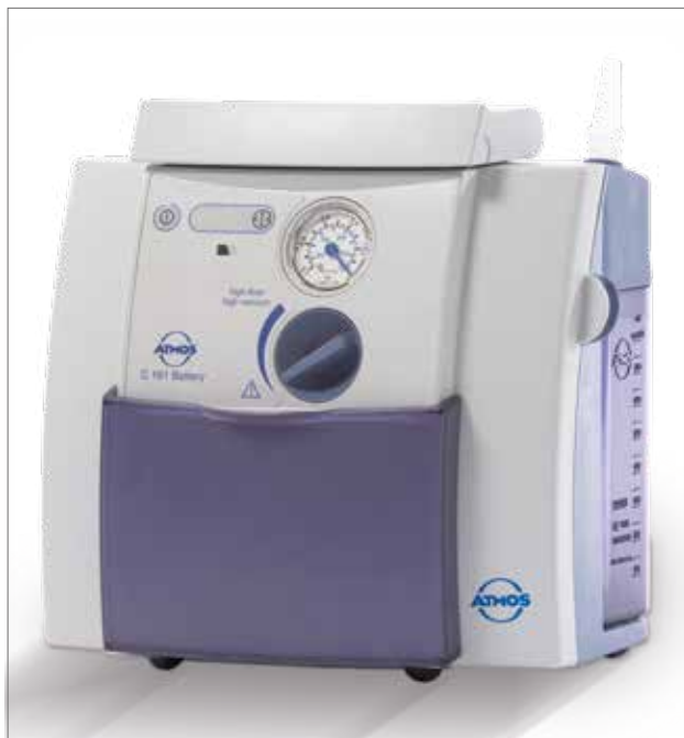
3 | Артикул 313.0400.0