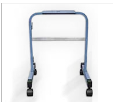
10 | Артикул 320.0070.2