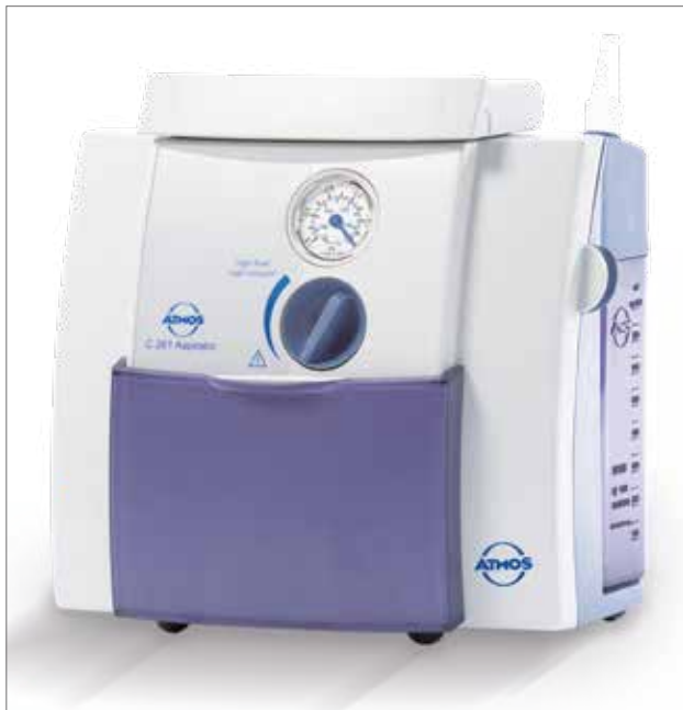
1 | Артикул 313.0100.0